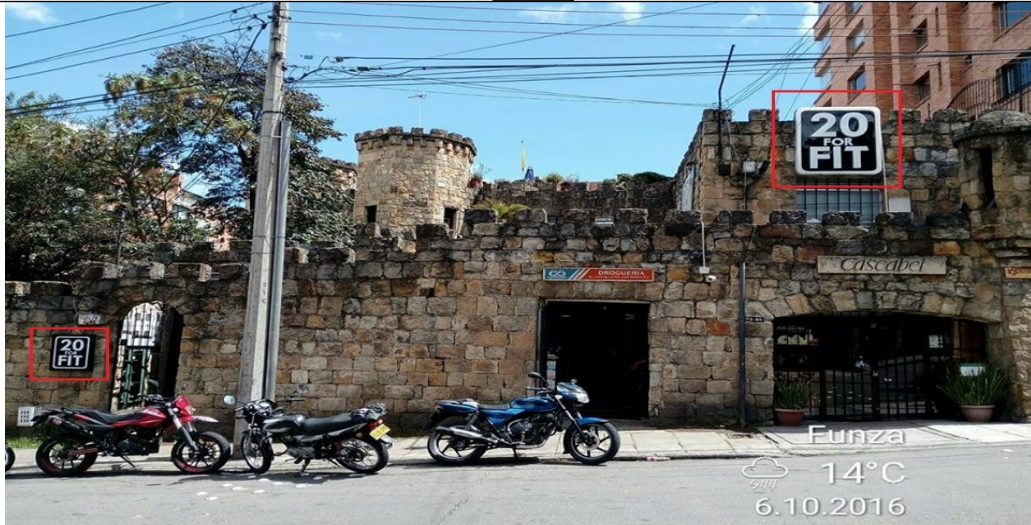
Fotografía No. 1: Panorámica de los Avisos del establecimiento 20 FOR FIT S.A.S., ubicado en la Calle 74 No. 2 – 86 Piso 2, elemento tipo aviso en fachada.

Registro fotográfico, Visita No. 2 efectuada el día 17/11/2016.